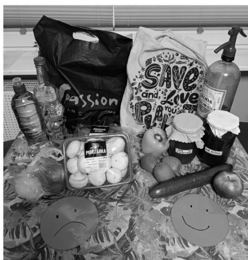
AUTOR: NATALIA MUSIAŁ