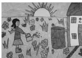
AUTOR: WERONIKA MOROZ