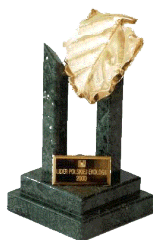
„Lider Polskiej Ekologii”, nagroda otrzymana w roku 2008 z rąk Ministra Środowiska, prof. Macieja Nowickiego